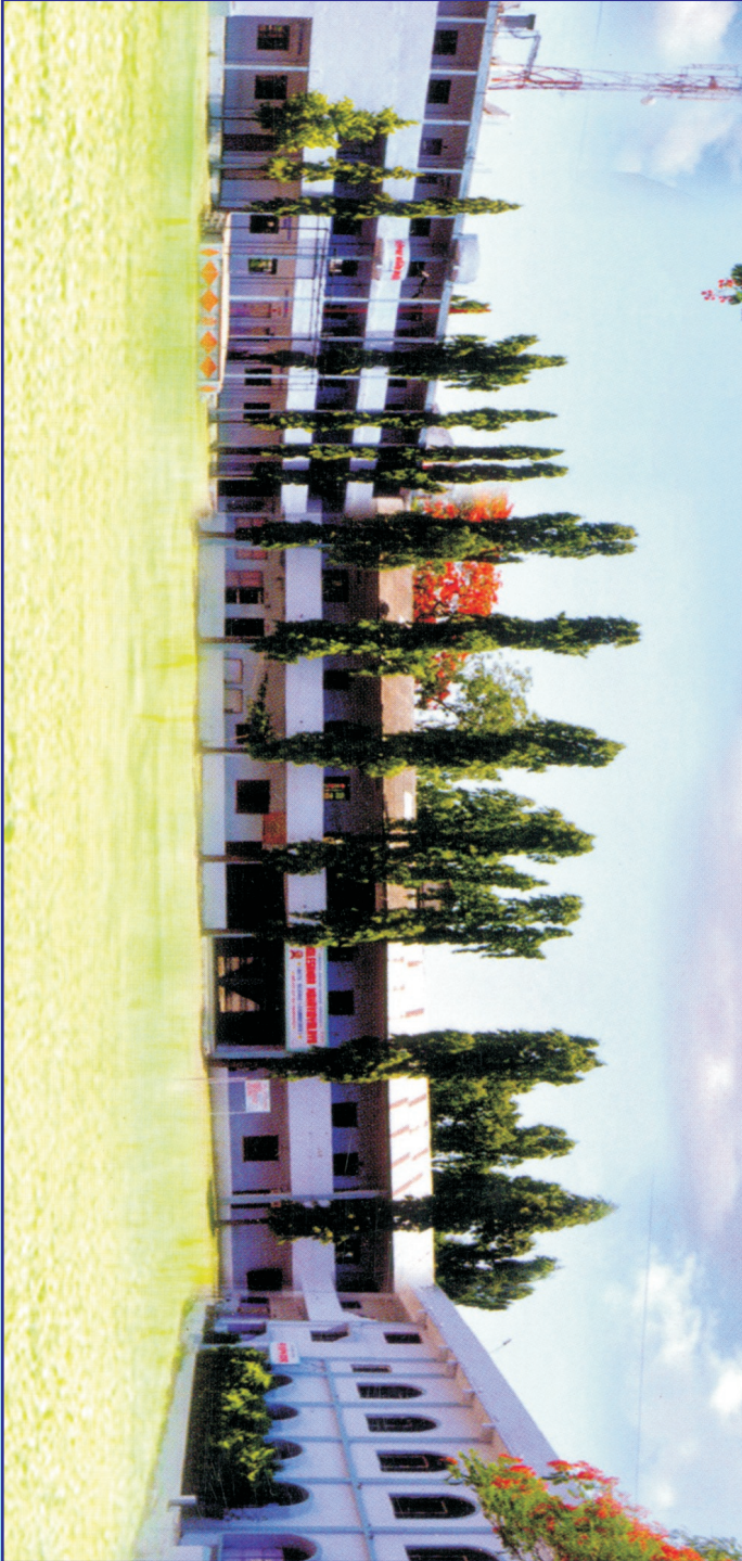
Kholeshwar Mahavidyalaya Ambajogai